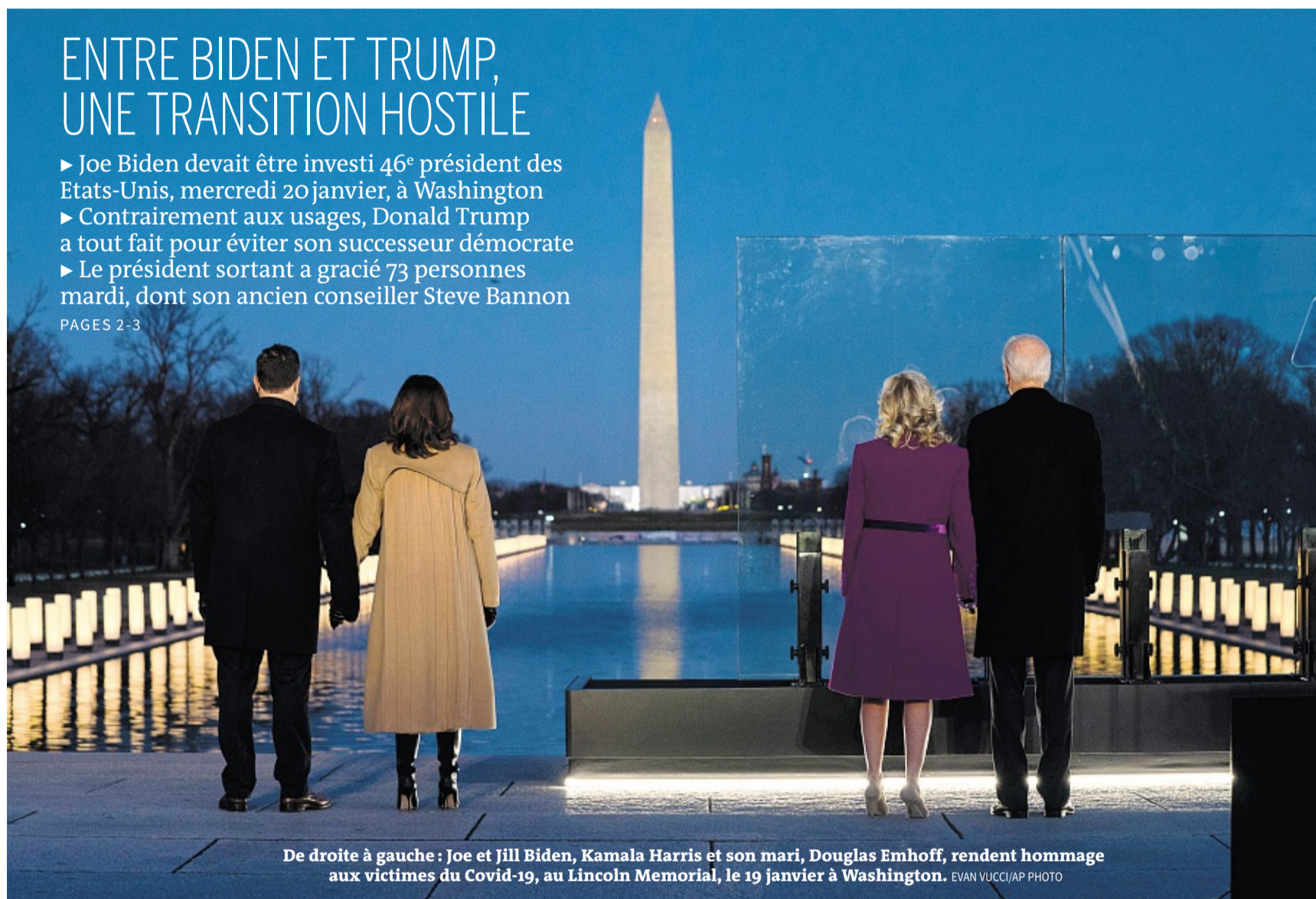
De droite à gauche : Joe et Jill Biden, Kamala Harris et son mari, Douglas Emhoff, rendent hommage aux victimes du Covid-19, au Lincoln Memorial, le 19 janvier à Washington.